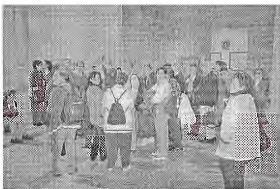
Dos moments de la visita a Sant Pere de Galligants